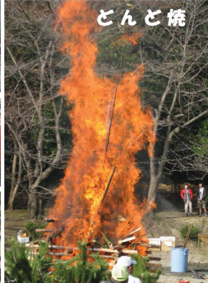
1月8日、穏やかな晴天に恵まれ、恒例のどんど焼きが行われました。