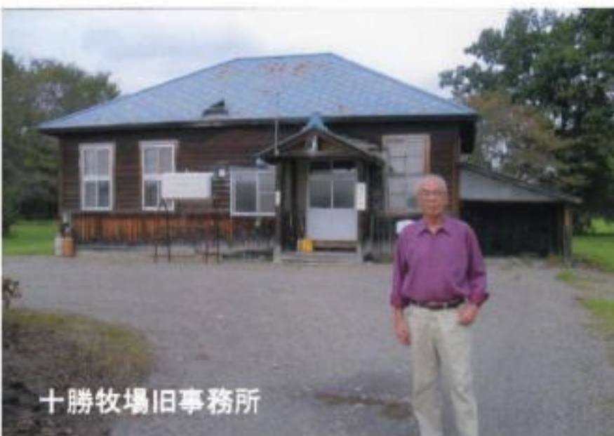
十勝牧場旧事務所

同じ音更町にある十勝川温泉に宿をとり、翌日十勝牧場を目指すことにした。帯広からバスに乗り、通か遠くの十勝牧場というバス停で降りた。あたりには何も無く、全く観光地らしくなかった。暫く行くとぼつんと十勝牧場の標識があり、その先に通か遠くまで広い道が続いている。人っ子独り通らず、道を聞くことも出来ない。案内所も店も無く、道は限りなく遠い。一体ここは観光地なのだろうか。だがここは北海道の十勝、スケールが違うのだ。それに路線バスと徒歩で来る者など居らず、皆車で来るのだ。漸く事務所を見つけた。入口に「独立行政法人家畜改良センター十勝牧場」とある。受付窓口で来意を告げ、昔のことを知っている人が居ないか訊ねたが、当然のことながらそのような人は居なかった。対応の男性が、昨年創った「十勝牧場創立100周年記念誌」があるのでそれを差し上げましようと言う。牧場と馬の表紙の美しい立派な冊子だった。思わぬ資料を戴いて有難かった。事務所を後にして暫く行くと背後から声が出た。先程と違う若い職員が、昼休みなんで車で場内を案内しようと言ってくれた。古い建物も僅か残っているという。明治、大正の頃に建てられた事務所の建物が、今も何かに使われて残っていた。父の居る事務所に遊びに行った子供の頃の記憶が、かすかに蘇った。住んで居た官舎の跡は勿論無い。一巡した後で展望台へ、広大な牧場の果てに日高山地、反対側には大雪山系が見えた。更に白樺並木へ行った。青年の好意が心底嬉しかった。謝意を述べて別れ、美しい白樺並木を一直線にゆっくり歩いてバス停に向かった。嬉しく、楽しい一日だった。