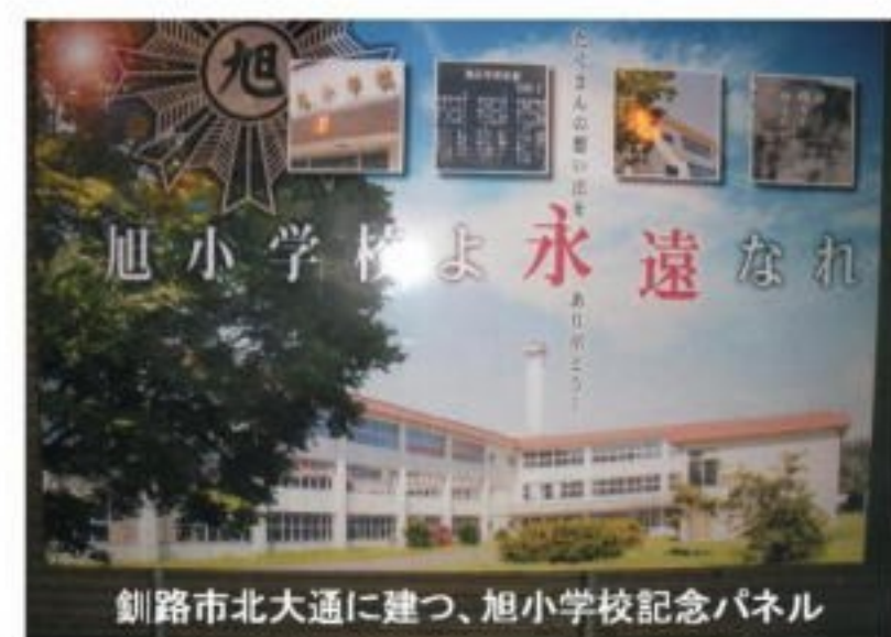
釧路市北大通に建つ、旭小学校記念パネル

同じ音更町にある十勝川温泉に宿をとり、翌日十勝牧場を目指すことにした。帯広からバスに乗り、通か遠くの十勝牧場というバス停で降りた。あたりには何も無く、全く観光地らしくなかった。暫く行くとぼつんと十勝牧場の標識があり、その先に通か遠くまで広い道が続いている。人っ子独り通らず、道を聞くことも出来ない。案内所も店も無く、道は限りなく遠い。一体ここは観光地なのだろうか。だがここは北海道の十勝、スケールが違うのだ。それに路線バスと徒歩で来る者など居らず、皆車で来るのだ。漸く事務所を見つけた。入口に「独立行政法人家畜改良センター十勝牧場」とある。受付窓口で来意を告げ、昔のことを知っている人が居ないか訊ねたが、当然のことながらそのような人は居なかった。対応の男性が、昨年創った「十勝牧場創立100周年記念誌」があるのでそれを差し上げましようと言う。牧場と馬の表紙の美しい立派な冊子だった。思わぬ資料を戴いて有難かった。事務所を後にして暫く行くと背後から声が出た。先程と違う若い職員が、昼休みなんで車で場内を案内しようと言ってくれた。古い建物も僅か残っているという。明治、大正の頃に建てられた事務所の建物が、今も何かに使われて残っていた。父の居る事務所に遊びに行った子供の頃の記憶が、かすかに蘇った。住んで居た官舎の跡は勿論無い。一巡した後で展望台へ、広大な牧場の果てに日高山地、反対側には大雪山系が見えた。更に白樺並木へ行った。青年の好意が心底嬉しかった。謝意を述べて別れ、美しい白樺並木を一直線にゆっくり歩いてバス停に向かった。嬉しく、楽しい一日だった。