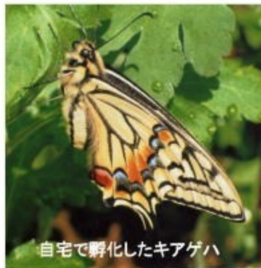
自宅で孵化したキアゲハ