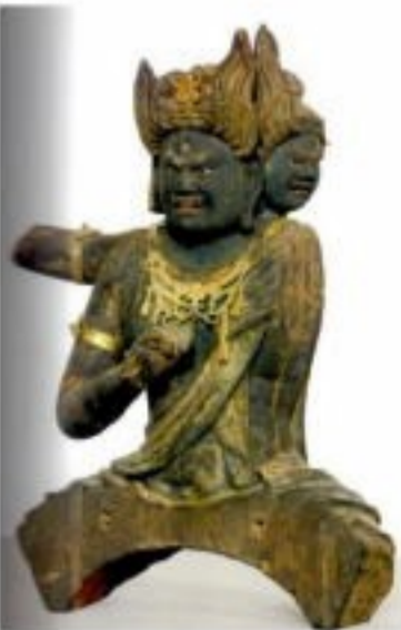
金沢文庫 重要文化財 大威徳明王坐像

その他片吹の太寧寺には「へそ薬師」といわれる横浜市指定文化財の薬師如来坐像があります。内部から「目」と書かれた紙片が見つかったそうで目の病気に対する御利益が多いと信じられていたようです。この薬師如来を取り巻き、十二神将像がありましたが現在は奈良国立博物館に所蔵されています。源頼朝の弟範頼が瀬ヶ崎に創建したと伝わる古寺で戦前追浜の飛行場の拡張にともない現在地に移転しました。お寺を訪ね、来歴や仏像の推移を調べ、勝手にいろいろ想像するのも楽しいものです。 齋木