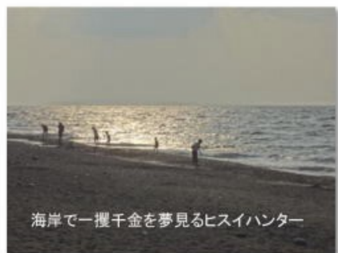
海岸で一攫千金を夢見るヒスイハンター