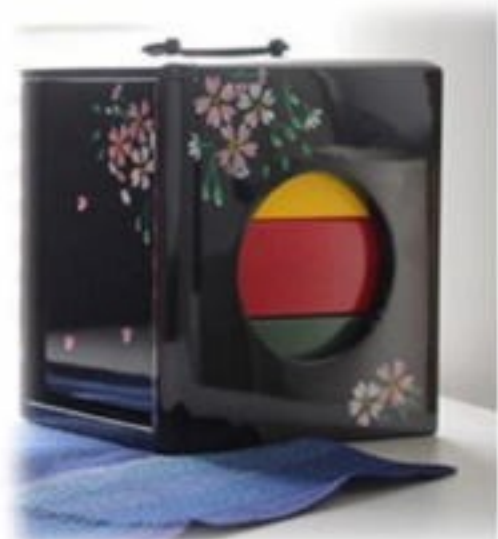
復刻版で買い求めた遊山箱

先年故郷に行く予定があって幼友達に会うことがあり、遊山箱が復刻されていることを知った。早速買い求めたが、当時のものとはだいぶ趣も違っている。が、時々お弁当を詰めて使うことにしている。