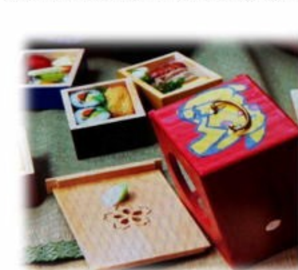
こんな風に詰めた

桜が咲いてお節句になると、近所の友達どうし“ゆさんせーにいこー”と誘い合って花見に行ったものである。桜が綺麗で遊べるところがお目当て、いつも向いの禿山が人気、天然のすべり台のような坂が幅広く湾曲し、松と桜・ため池もあり、シラサギも生息しているいい景色だったのである。(そういえば清水の側溝には珍しいモウセンゴケもあった。)