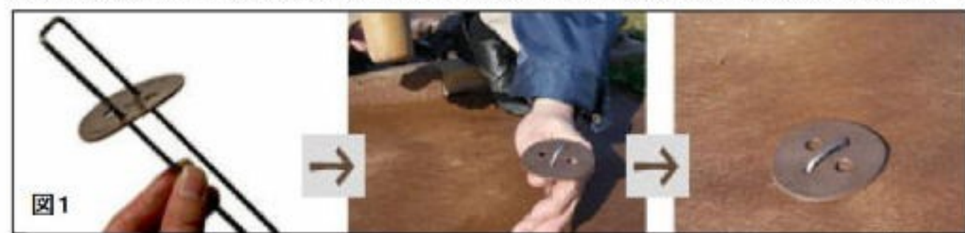
図1 固定ピンの打ち込み方法

庭の雑草対策の一つとして「防草シート」を張る方法があります。防草シートは、除草してシートをピンで止めるだけの比較的簡単な作業で設置が出来ます。今回はすでにご自分で張った防草シートの張替のお手伝いをしましたので、そこで調べたいいくつかの注意点を述べたいと思います。 まず古くなった防草シートをきれいに取り除きます。防草シートは雑草の上から敷いたり、でこぼこの地面にそのまま敷いたりすると隙間ができ、シートの擦れや破れに繋がる恐れがありますので、綺麗に雑草を取り除き(冬場の雑草の少ない時期のほうが作業が楽です)、整地するのが望ましいです。 整地が済んだら防草シートを敷いていきます。この時、できるだけ地面とシートの間隙なく張るのが長持ちするためのコツです。また、シートとシートの重ね合わせ部分は10cmを目安に設けてください。隙間から生えてくる雑草を防ぎます。壁際や角の部分も多めにシートを残して張りつけ、隙間から生えてくる雑草を防ぐと良いでしょう。 防草シートの固定には専用の固定ピンを使用します。むき出しで張る場合は50cm間隔を目安にピンを多めに打込みます(図1、2)。強風や台風の影響を受ける場所では、しっかりと防草シートを地表に固定しましょう。 風でめくれてしまった場合、大きく破れてしまう恐れがあります。小さな破れは専用の粘着テープで補修しましょう。(坂口)