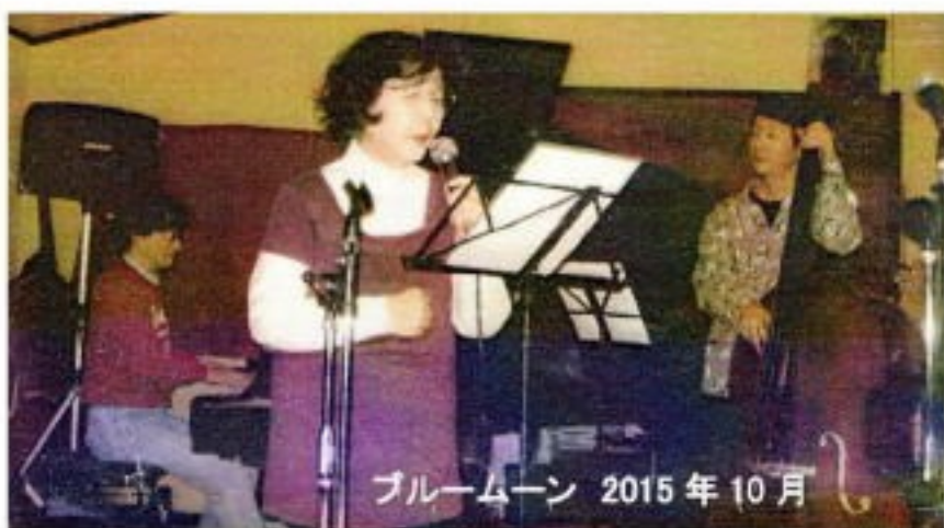
ブルームーン 2015年10月