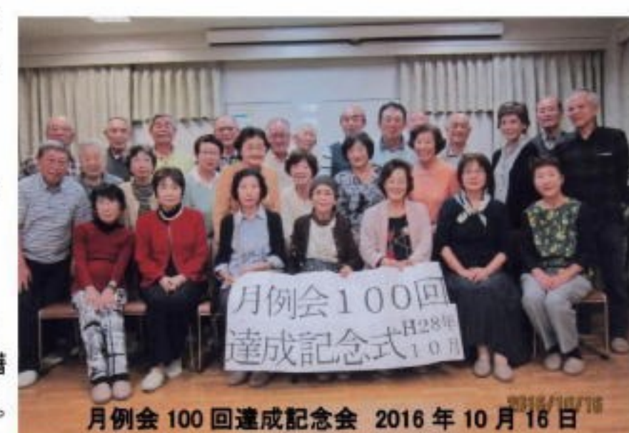
月例会100回達成記念式 2016年10月16日