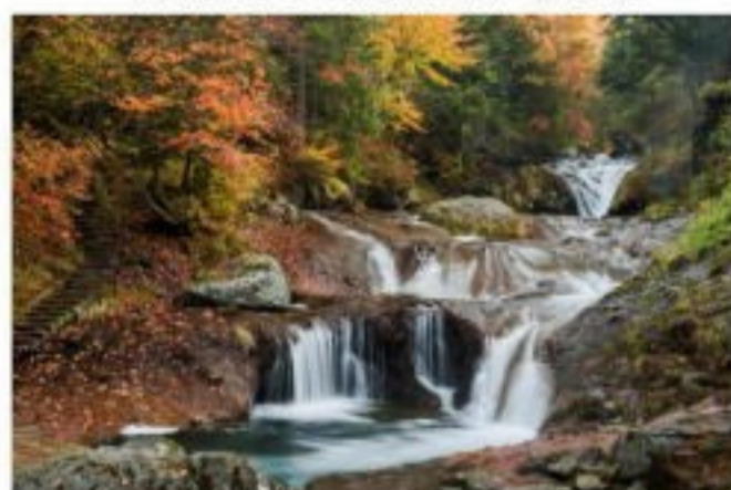
おしどり隠しの滝